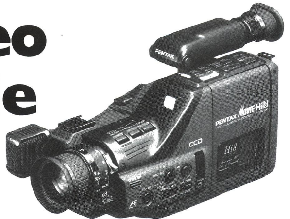
Pentax PV-C8000E er et kompakt og let Hi-8 kamera. Merprisen i forhold til standardmodellen er ca. 4.000 kroner.

Til gengæld er Pentax aktuel her hos os med et nyt video-8 kamera, der giver flere end 400 liniers billedopløsning, takket være Hi-8 standarden. Kameraet hedder PV-C8000E, koster 16.000 kroner, og er